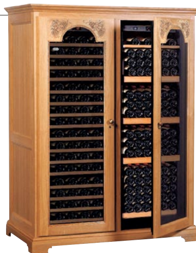
SKAPERTRANG: Det kan komme mye godt ut av et skaper. Dette eksklusive vinskaper fra Dometic koster 144.000,- kroner.

AV ANDREAS KLEMSDAL ANDREAS.KLEMSDAL@FINANSAVISEN.NO